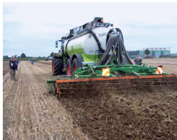
Emissionsmindernde Ausbringtechnik für Wirtschaftsdünger