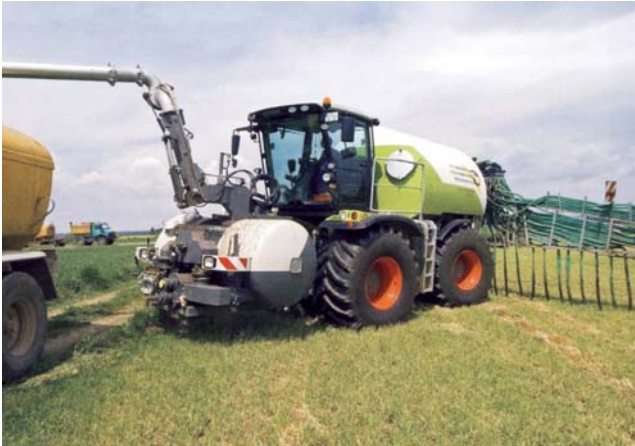
Grünland: Emissionsmindernde Ausbringtechnik

Die Tierhaltung in Deutschland wird aufgrund der Feststellung und Bewertung der Zusammenhänge und Ursachen durch den Klimawandel in unterschiedlichem Maße betroffen sein. Bei den Anpassungsstrategien innerhalb der Produktionsverfahren sind tierartspezifische und regionale Aspekte zu beachten, die zu flexiblen und abgestuften Anpassungsstrategien führen.