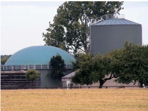
Energetische Gülleenutzung in Biogasanlagen

In der Tierhaltung bestehen folgende Ansatzpunkte zur Reduzierung von Treibhausgasemissionen.